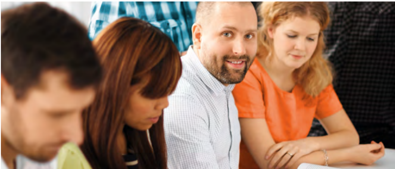
Under 2018 har säljträning genomförts i Sverige och i Finland.